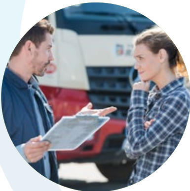
Info trafic / sécurité routière et règles du transport