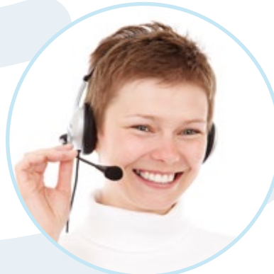
Maintien du lien / bonnes pratiques en télétravail