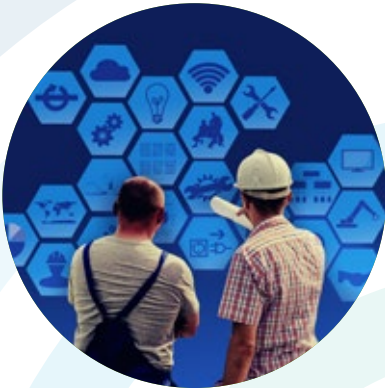
Mise en Sécurité / Rappel des consignes logistique

Parce que chaque entreprise est différente, KISDIS® s'adapte aux spécificités de votre activité. KISDIS® travaille déjà auprès de nombreux secteurs avec des utilisations variées et propres à chacun.