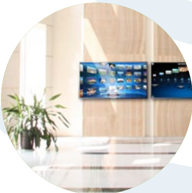
Accueil et information des Salariés au siège social