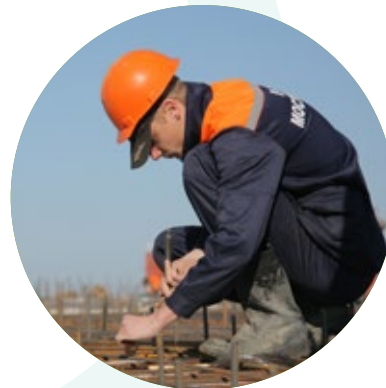
Suivi des chantiers / conseils postes de travail et santé