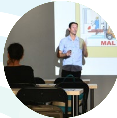
Formation et Information des interimaire